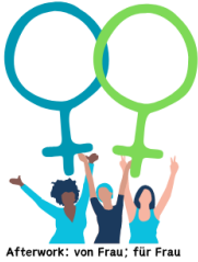
Afterwork: von Frau; für Frau