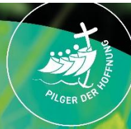
Text: Miriam Falkenberg; Layout: Sven Jäger - Medienhaus Bistum Würzburg

Frühling das ist die Photosynthese der Hoffnung bei diesen Neugeburten aus Hellgrün könnte ich weinen vor Erleichterung dass uns jeden Tag mehr Licht geschenkt wird mehr Farbe dass Anfänge nachwachsen gerade jetzt wo die Zuversicht dabei war sich zu verabschieden wo mir die Zukunft schwarz entgegen gerollt ist nun aber scheint alles noch möglich das Leben lässt sich nicht aufhalten das Licht lässt sich nicht bezwingen in der Photosynthese der Hoffnung